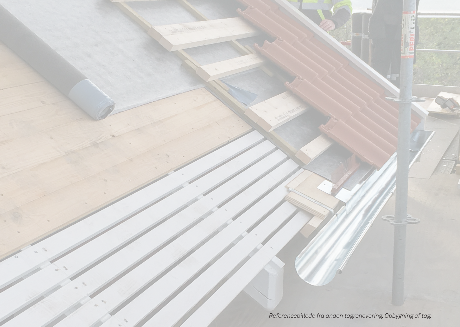
Referencebillede fra anden tagrenovering. Opbygning af tag.