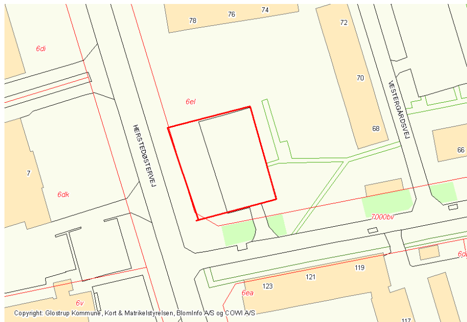
Figur 1. Placering af containerpladsen.